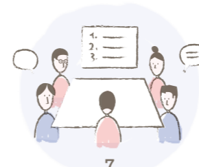
7 Tumorboard 3: Festlegung weiterer Behandlungsschritte