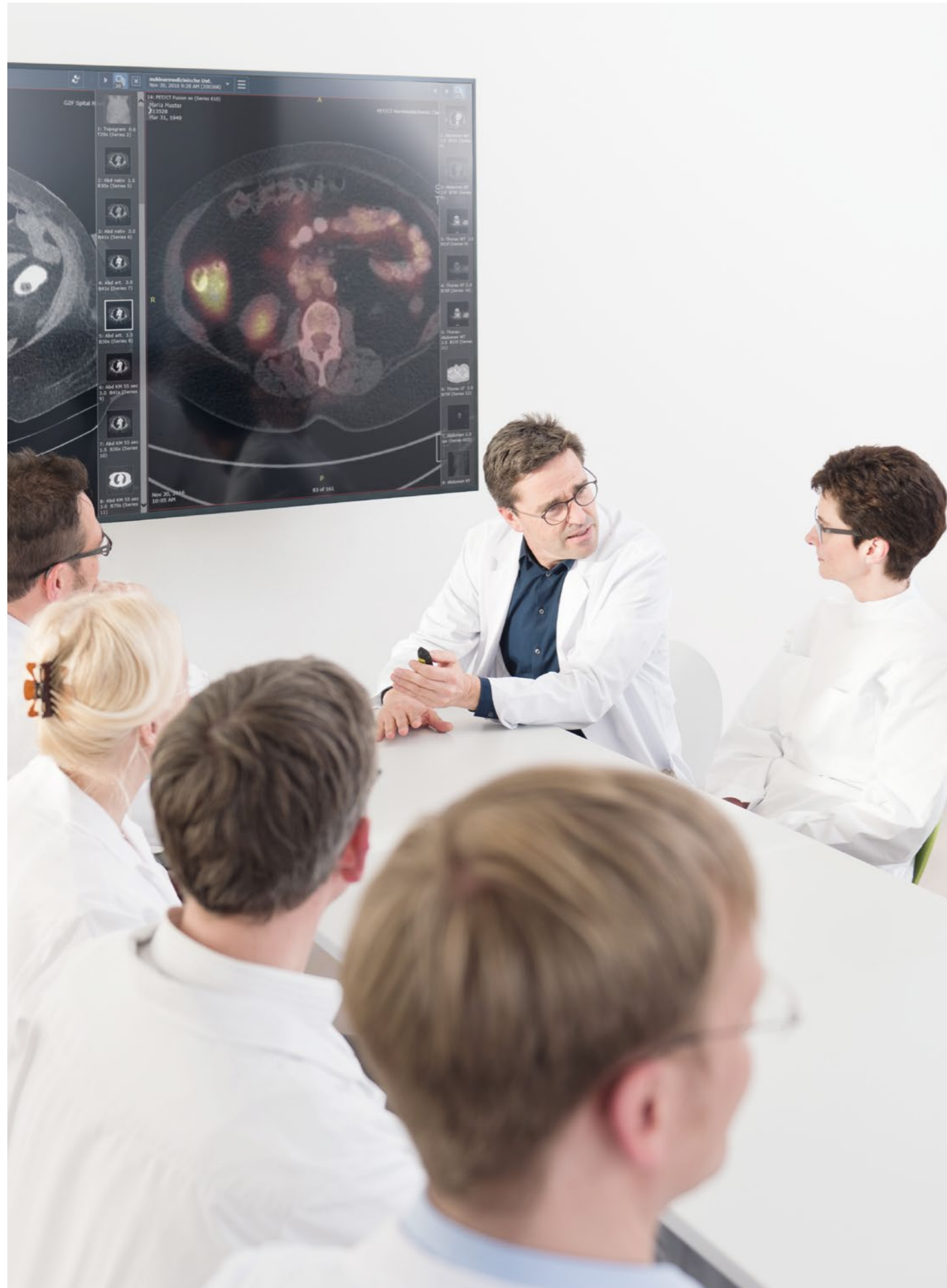
Vereintes Expertenwissen am häuserübergreifenden, interdisziplinären Tumorboard