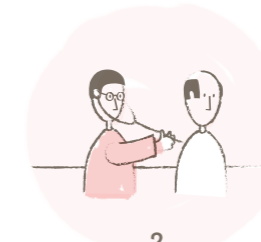
2 Untersuchungen am GZF