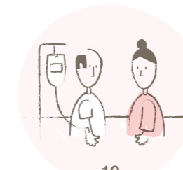
10 Nachsorge durch den Hausarzt sowie regelmässige Chemotherapie-Verabreichung und onkologische Sprechstunde am GZF