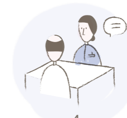
4 Überweisung ans Claraspital in Abstimmung mit dem Hausarzt: Hospitalisation, stationärer Aufenthalt und umfassende Abklärungen