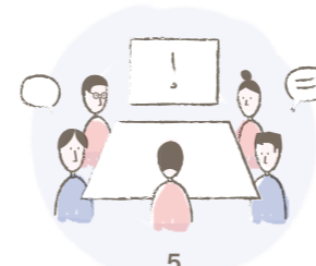
5 Tumorboard 2: Sicherstellung der Indikation für die Operation