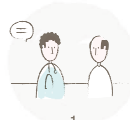
1 Erstklärung beim Hausarzt