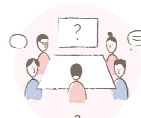
3 Tumorboard 1: Diagnosestellung eines Falles der hochspezialisierten Medizin