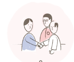
9 Tumorboard 4: Abschliessendes Tumorboard und Übergabe des Patienten ans GZF für die weitere wohnortnahe Betreuung