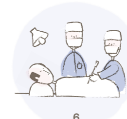
6 Eingriff am Claraspital