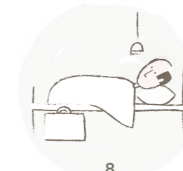
8 Aufenthalt in einer Reha